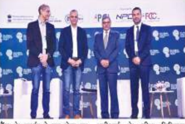
बैंक के गवर्नर ने इस सेवा का शुभारम्भ किया। समारोह में नेपाल के फोने पे और भारत की तरफ से यूपीआई के बीच डिजिटल कारोबार करने की शुरुआत हुई है। नेपाल के प्रधानमंत्री

पुष्पकमल पहाल प्रचण्ड की भारत यात्रा के दौरान दोनों देशों के बीच डिजिटल माध्यम से लेनदेन का कारोबार शुरू करने को लेकर समझौता पर हस्ताक्षर किया गया था। गुरुवार से इसकी शुरुआत भी हो गई है। अब नेपाल आने वाले भारतीय पर्यटकों, व्यवसायियों सहित सभी प्रकार के नागरिकों के लिए नेपाल में कारोबार करना आसान हो जाएगा। भारतीय नागरिक अब यूपीआई के माध्यम से अपने बैंक खातों से सीधे किसी भी ई-वॉलेट के जरिए पेमेंट कर सकते हैं।