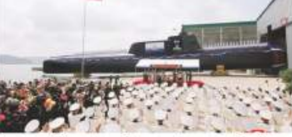
देखकर दुश्मनों की रूढ़ कांप जाएगी। उन्होंने यह संकेत दिया कि इस कदम का उद्देश्य अमेरिकी परमाणु संचालित पनडुब्बियों का मुकाबला करना है। यह पनडुब्बी 10 मिसाइल ट्यूब से सुसज्जित है।

सियोल। उत्तर कोरिया ने अपनी नवनिर्मित सामरिक पनडुब्बी का अनावरण किया है। यह पनडुब्बी के भीतर परमाणु हमला करने में सक्षम है। इस मौके पर राष्ट्रपति किम जोंग-उन ने उत्तर कोरिया के परमाणु निरोध को और मजबूत करने का संकल्प लिया। वह जानकारी स्थानीय मीडिया रिपोर्ट्स में दी गई है। रिपोर्ट्स में कहा गया है कि आयोजित पनडुब्बी के अनावरण समारोह में उत्तर कोरिया कई नेताओं ने भाग लिया। मीडिया रिपोर्ट्स के मुताबिक इस पनडुब्बी को हीरो किम कुन ओके नाम दिया गया है। किम ने कहा है कि यह हमारी हमारी शक्ति का प्रतीक है। इस कदम का उद्देश्य अमेरिकी परमाणु संचालित पनडुब्बियों का मुकाबला करना है। यह पनडुब्बी 10 मिसाइल ट्यूब से सुसज्जित है।