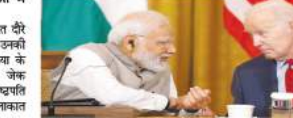
इसके जवाब में जेक सुलिवन ने कहा कि अभी वह इस बारे में कुछ नहीं कह सकते। हम मानते हैं कि भारत से लेकर मध्य पूर्व और फिर यूरोप तक की कनेक्टिविटी बेहद महत्वपूर्ण है और इससे बड़ा आर्थिक फायदा होगा। साथ ही इसकी राजनीतिक अहमियत भी है। हालांकि अभी इस बारे में ज्यादा कुछ नहीं कहा जा सकता।

है और पहले भी वह इन मुद्दों पर बोलते रहे हैं। जेक सुलिवन ने कहा कि जो बाइडन अन्य नेताओं के साथ भी बैठक करेंगे और जी20 सम्मेलन के बाद वियतनाम के लिए राखत होंगे। भारत के साथ रेल लिक प्रोजेक्ट पर क्या बोले सुलिवन अमेरिका क्या भारत और संयुक्त अरब अमीरात के साथ एक बड़े रेल लिक प्रोजेक्ट की योजना बना रहा है?