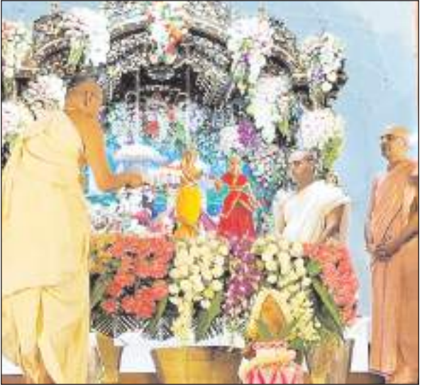
बंगला, झूलन उत्सव, छपन भोग, लड्डू गोपाल अभिषेक,

मथुरा/टीएम एक्शन इंडिया वृन्दावन के भक्ति वेदांत मार्ग स्थित चंद्रोदय मंदिर में गुरुवार को लीला पुरुषोत्तम भगवान श्रीकृष्ण के 5249 वे प्राक्टयोट्सव को बड़े ही हर्षोल्लास एवं धूमधाम के साथ मनाया गया। भाद्रपद के कृष्ण पक्ष की अष्टमी के पावन पर्व पर श्री कृष्ण जन्माष्टमी महामहोत्सव के दौरान भक्तों द्वारा मंदिर प्रांगण में भव्य फूल